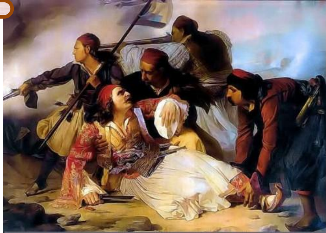
Λουδοβίκος Λιπαρίνι, Ο θάνατος του Μάρκου Μπότσαρη

Το πτώμα του Μάρκου Μπότσαρη μετεφέρθη υπό των συντρόφων του εις την Μονή της Παναγίας εις Προυσόν και εναπετέθη εις το «κελί της Παναγίας». Εκεί ήλθεν ο Γ. Καραϊσκάκης, νοσηλευόμενος κατ' εκείνην την εποχήν εις την Μονήν, και ασπασθείς τον νεκρόν ένδακρυσ ηυχήθη: «Άμποτε να πάω κι εγώ από τέτοιο θάνατο αδελφέ Μάρκο».