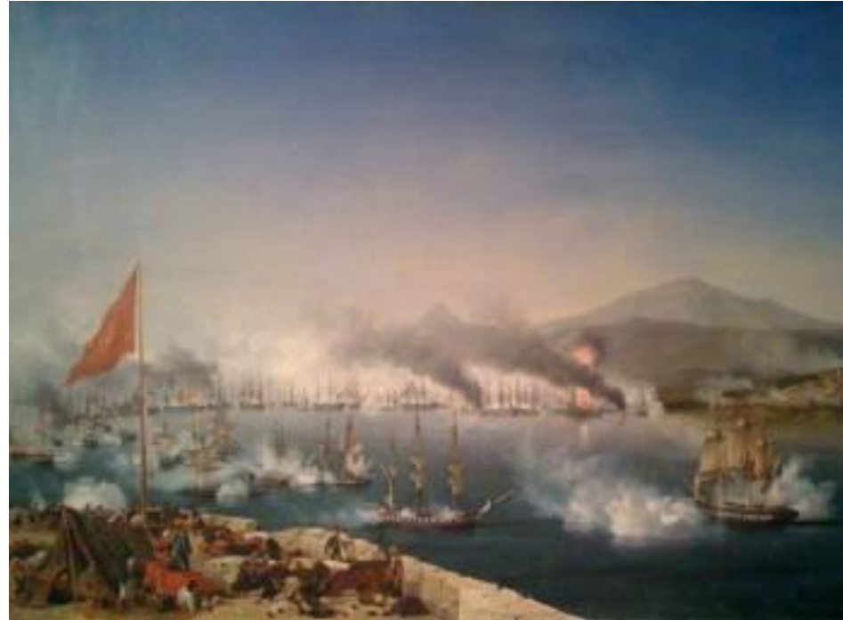
Λουίς Λκαρνερέ, Η Ναυμαχία του Ναυαρίνου

[Τα γεγονότα της ναυμαχίας όπως καταγράφονται στη συνείδηση του κεντρικού ήρωα του μυθιστορήματος της Ρέας Γαλανάκη, απόσπασμα από τον Βίο του Ισμαήλ Φερικ Πασά ]